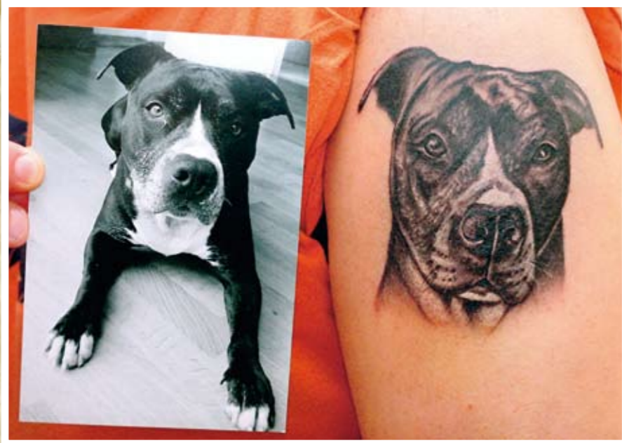
Das muss Liebe sein: Hundi am Oberarm