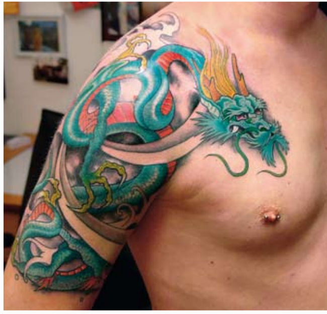
Heute noch genau so beliebt wie vor 25 Jahren: Japanische Drachen

»Das Level ist enorm gestiegen und die Jungtätowierer müssen in kürzester Zeit ein hohes Niveau erreichen.«