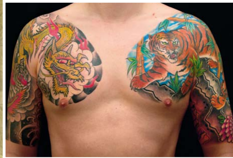
Tiger & Dragon in klassisch-japanischer Aufteilung der Brust und Oberarme

schaft zum größten Teil aus Punks, später kamen noch Biker dazu – andere Personen ließen sich damals, als viele von euch noch nicht mal geboren waren, nämlich gar nicht tätowieren. Kundschaft bekam Alex nur und ausschließlich über Mundpropaganda. Die Adresse eines richtigen Tätowierers war damals einiges Wert und man musste sich lange durchfragen, bevor man jemanden fand, der nicht nur mit Nähnadel und Rotring-