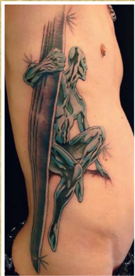
Der Marvel-Comicheld »Silver Surfer«